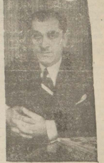
Maarif Vekili Hasan Âli Yücel

1 — İlk, orta, mesleki ve teknik öğretim okul ve kursları ile ilse ve öğretmen (Devamı 5 inci sayfada)