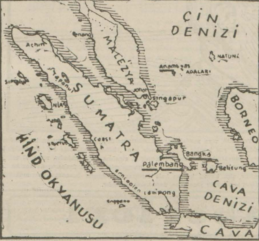
Sumatra adasını gösterir harita

Cok güzel bir hikâye Yazan: Salâhattin Enis [Bugün 10 sayfalarmızda]